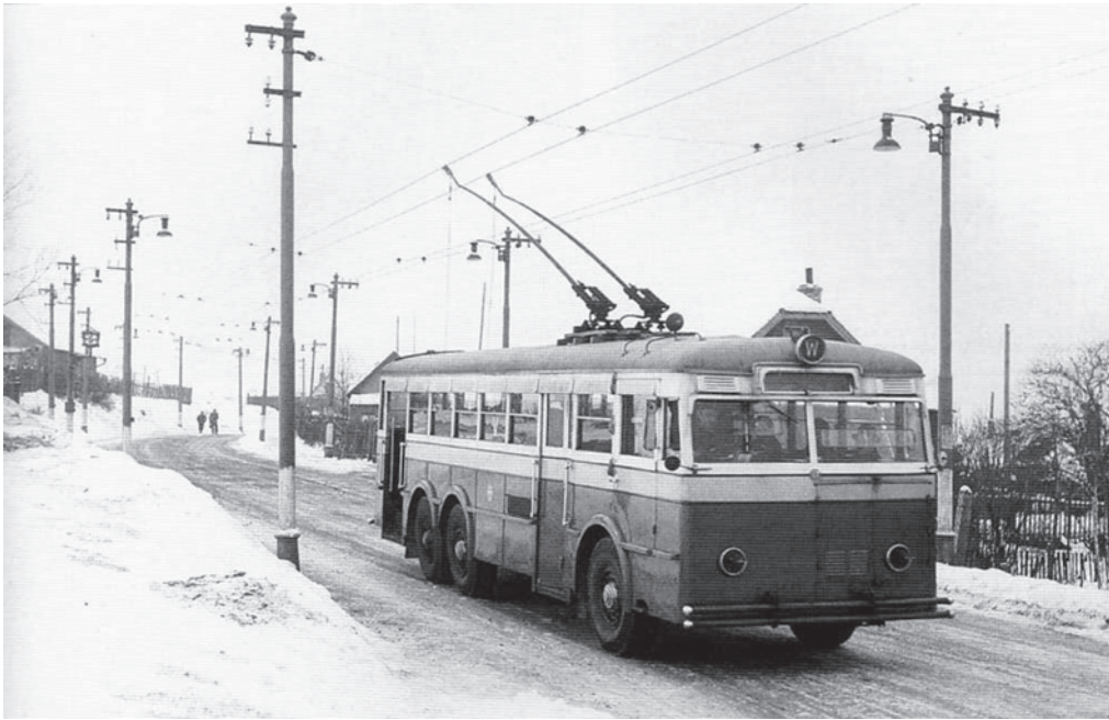
Trat' k jinonické Waltrovce.