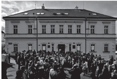
PŮVODNÍ STARÁ ŠKOLA, DNES WALDORFSKÁ. BUTOVICKÁ 228/9

Od roku 1744 až do roku 1760 na škole učil Isidor Sčeta, po něm nastoupil Antonín Heřman, který zde v roce 1799 zemřel. Následně převzal školu