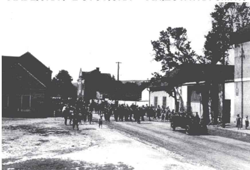
ULICE BUTOVICKÁ V DOBÁCH, KDY JEŠTĚ NEBYLA PROTUNATA RADLICKOU. POHLED SMĚREM OD BUTOVICKÉHO RYBNÍKA.

RADLICKÁ SPOJKA nekompromisně rozdělila kdysi rozkopanou, ale poklidnou vesničku na periferii Prahy na dvě části. Myslím, že to bylo v letech 1986–1987. Např. přebíhání dorostenců Motorletu na škvárové hřiště bylo sázkou do loterie, přechod u Tyršovy základní školy byl zcela bez výhledu, z jinonické cihelny se dalo vyjet bezpečně pouze na ulici Radlickou, dále doprava a o pár stovek metrů níže se nebezpečně otočit, aby se do Jinonic dalo dojet. Bohužel jsem byl svědkem bouračky na Velikonoce roku 1991. Starší řidička se mě ptala v blízkosti bývalé konečné autobusu č. 128, jestli jede dobře k jinonickému kinu. Lámanou angličtinou jsem ji přisvědčil, že ano. Podle mě emigrovala před x lety do Švédska a nedošla jí zákeřnost této křižovatky, jela zcela po paměti a v plné rychlosti