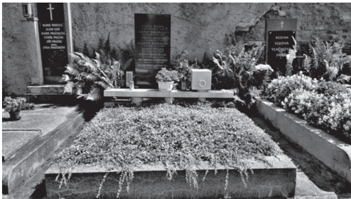
JINONICKÝ HŘBITOV NA KTERÉM JE JEDNA Z DÍVEK POCHOVÁNA.