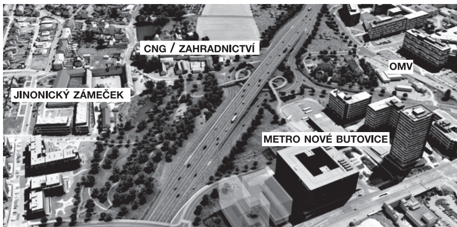
POHLED NA BUDOUCÍ MIMOÚROVŇOVOU KŘÍŽOVATKU MEZI JINONICEMI A NOVÝMI BUTOVICEMI.

Radiály jsou ve své podstatě pokračováním dálnic nebo jiných rychlostních komunikací v mezikruží mezi vnějším a vnitřním dopravním okruhem města. V ideálním stavu by po radiálách neměla jezdit vozidla, která nemají zdroj nebo cíl cesty ve městě, což je tzv. tranzitní či zbytná doprava, která patří na vnější (dálniční) okruh města.