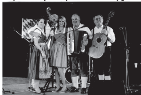
Německá škola v Praze / Deutsche Schule Prag Schwarzenberská 1, Praha 5 - Jinonice