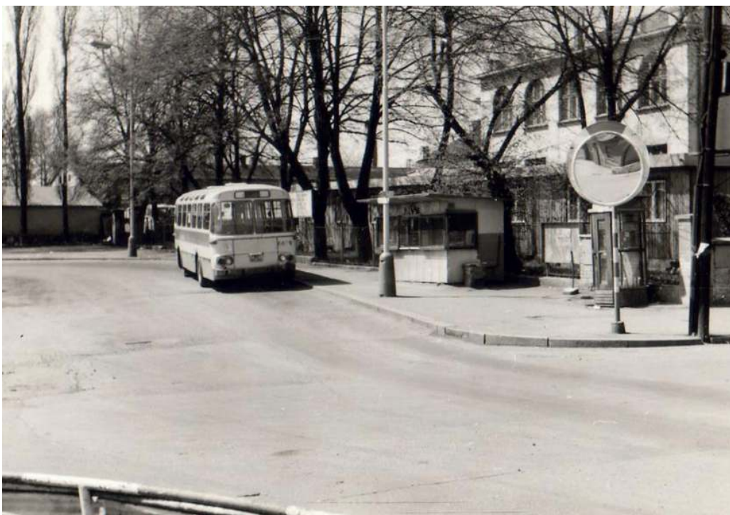
KONEČNÁ LINKY Č.128 (V TÉ DOBĚ JIŽ AUTOBUSU) U JINONICKÉ SOKOLOVNY, ROK 1980.