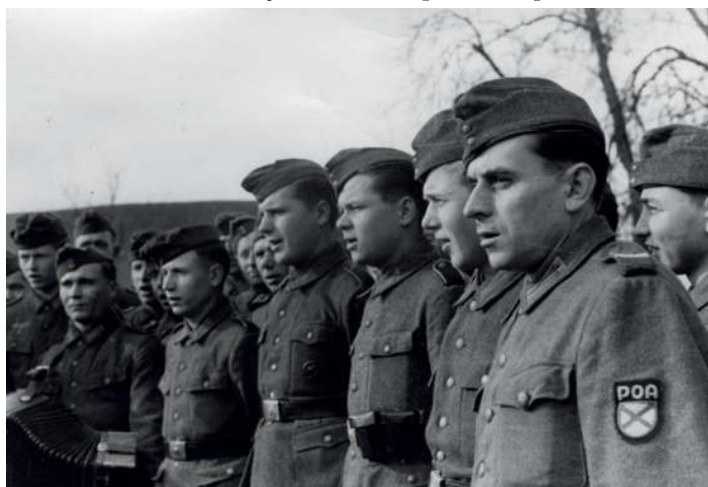
NÁSTUP JEDNOTKY VLASOVců V ROCE 1944, VIZ ZNAK NA PAŽI.

Rád bych zdůraznil, že obránci Prahy neměli k dispozici žádnou těžkou bojovou techniku. Vlasovců bylo na 20 000 mužů, použili k jejich podpoře svůj tankový oddíl v prostoru Velké Chuchle a dělostřelecký oddíl v Jinonicích. Dobytím letiště Ruzyně znemožnili Němcům použít letectvo k bombardování Prahy a jiným leteckým úderům. Z působení ROA v Praze při květnovém povstání je jasné, že toho, co svým vojenským zásahem dokázala, není málo. Z přímých bojů měla ROA cca 300 zabítých mužů. V jejich moci se ocitly Jinonice, Ruzyně, Smíchov, část Malé Strany, Břevnov, část Vinohrad, Vršovic a Pankráce i většina předměstí na západním okraji města. Především se podařilo zabránit mnohem většímu krveprolití, které by nastalo, kdyby zůstali