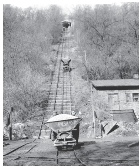
VÝTAH MEZI PRVNÍ A TŘETÍ ETÁŽÍ.