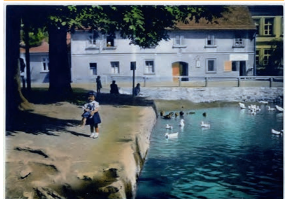
JINONICKÝ RYBNÍK NA VZÁCNÉ KOLOROVANÉ FOTOGRAFII.