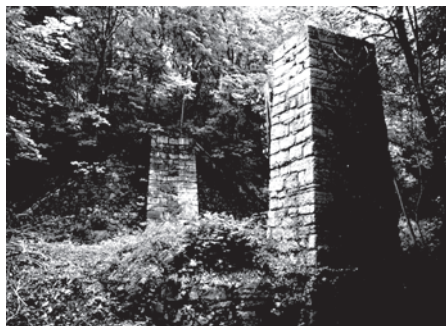
ZBYTKY PŘEMOSTĚNÍ BUŠŤHRADSKÉ DRÁHY.