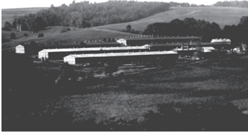
DŘEVĚNÉ VOJENSKÉ LEŽENÍ V MOTOLE, JIŽNĚ OD PLZEŇSKÉ ULICE.