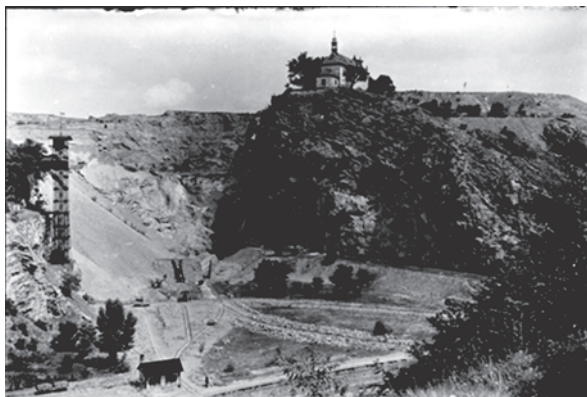
KOSTELÍK SVATÉHO PROKOPA TÝČÍ SE NAD BÝVALÝM LOMEM.