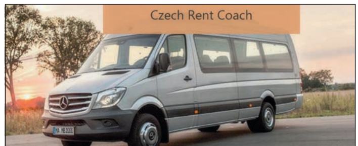
Czech Rent Coach