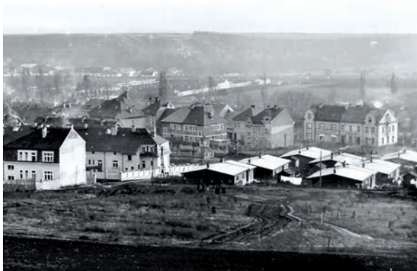
POHLED NA KOLONII ARIZONA Z VIDOULE.

Prostá dřevěná stavení velice podobná vojenským provizorním kasárnám či zajateckým táborům. Na střeše pouze dehtový papír, policie tam v noci raději nechodila - a když, tak jedině ve dvou hlídkových vozech. To byla kolonie Arizona, která se nacházela na konci ulic Souběžná a Na Vidouli.